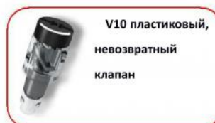
V10 пластиковый, невозвратный клапан